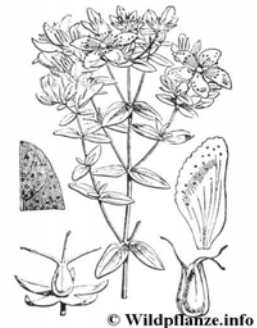
közönséges orbáncfű, Szent János füve, stb. lat. Hypericum perforatum = ( http:// http://wildpflanze.info/

Amarum: étvágyjavító szer Anthelminthicum: féreghajtó szer Aphrodisiacum: nemi vágyat fokozó szer Carminativum: puffadást csökkentő szer Cholagogum: epehajtó Cholereticum: epeürítést elősegítő Diaphoreticum: izzadást elősegítő Diureticum: vizelet kiválasztását és kiürülését elősegítő Expectorans: köptető Galactagogum: tejelválasztást fokozó Laxativum: hashajtó hatású Roborans: erősítő hatású Spasmolyticum: (simaizom) görcsoldó hatású Sedativum: nyugtató hatású