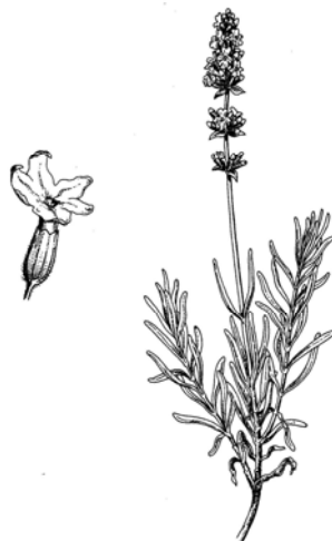
Lavandula angustifolia Mill. var. fragrans família: de Lamiaceae

Levendula, szagos levendula, illatos levendula, francia levendula, keskenylevelű levendula, közönséges levendula, orvosi levendula, lat. Lavandula angustifolia = ( http://upload.wikimedia.org )