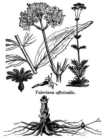
Macskagyökér, lat. Valeriana officinalis = ( http://catbull.com/alamut/Lexikon )

A sikeres terápia szempontjából fontos arról tájékozódni, hogy a gyógynövényből forrázatot, főzetet, tinktúrát, oldatot vagy hideg vizes áztatással készült kivonatot kell-e készíteni, hiszen a hatóanyagok kioldódása, stabilitása különböző. Az elkészítési mód mellett az adagolásra is oda kell figyelni, mivel a gyógynövények alkalmazása sem veszélytelen (a fent említett okok miatt). Természetesen lehetnek mellékhatásaik, sőt előfordul összeférhetetlenség más gyógynövény hatásával (pl. a hashajtó kutyabengekéreg és a hasfogó tölgyfakéreg együttes fogyasztása). A gyógynövény-alapú készítmények és a szintetikus gyógyszerek egyidejűleg történő alkalmazásánál pedig figyelembe kell venni, hogy egyes növényi hatóanyagok befolyásolhatják a gyógyszer hatóanyagának felszívódását és ezáltal annak hatását (pl. orbáncfű és a fogamzásgátlók egyidőben történő fogyasztása). A fent említett példák alapján kiderül, hogy a gyógynövények pontos ismerete nélkülözhetetlen, ha a gyógyításban vagy betegségek megelőzésében kívánjuk alkalmazni őket. A gyógyászatban felhasznált növényi eredetű gyógyszerek több mint 90%-a magasabbrendű növényekből származik. A hatóanyagot tartalmazó növények számát becslések szerint 250.000-re tehetjük. Napjainkig legfeljebb csak 10%-nak vizsgálták meg a kémiai összetételét. A növényvilág tehát még hatalmas és értékes tartalékokat rejt magában a korszerű gyógyászat számára.