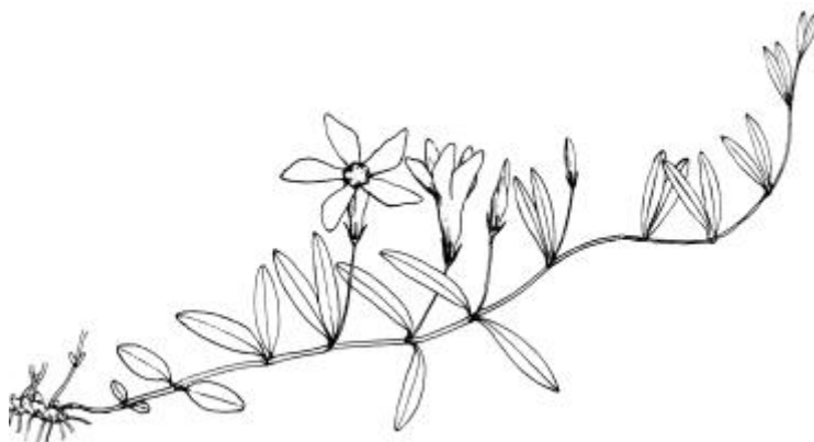
Pusztai meténg, lat. Vinca herbacea = ( http://gutenberg.igyfk.pte.hu/ )