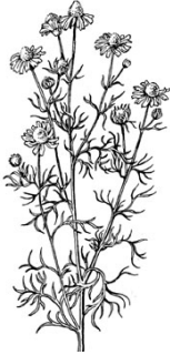
kamilla, székfűvirág, lat. Matricaria chamomilla =