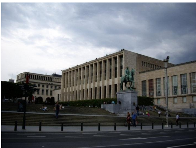
A Brüsszeli Királyi Könyvtár

könyvtáros kollegák (Kanada, Amerikai Egyesült Államok, Ausztrália és Dél-Afrika).