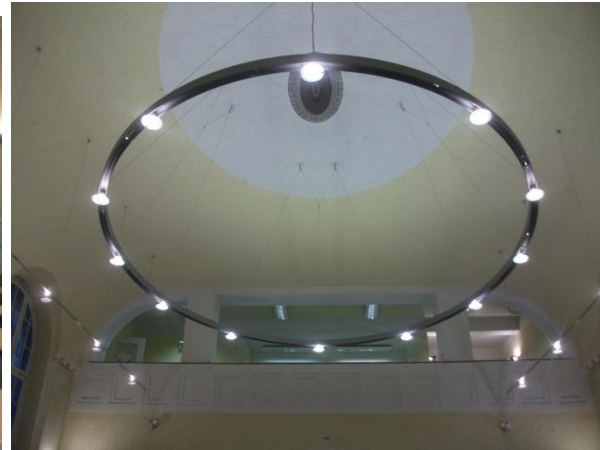
3. Régi kápolna, mostani olvasóterem

Könyvállomány tekintetében a könyvtár 2010 kötettel rendelkezik összesen, melyek főként tankönyvek, de vannak monografikus művek is. A tankönyvek nagy többsége német nyelvű, néhány angol. A Központi Könyvtárban levőkhöz hasonló címekkel és sorozatokkal találkoztunk a könyvespolcokat nézve, úgy, mint a Sobotta atlasz-sorozat vagy a Thieme kiadó könyvei. Egy-egy kötetből több kölcsönözhető példánnyal és két nem kölcsönözhető példánnyal rendelkeznek. A nem kölcsönözhetőeket piros