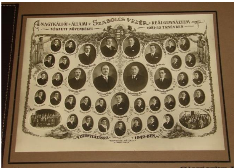
2. ábra Nagykovácsi Állami Szabolcs Vezér Realgimnázium végzett növendékei 1931-32